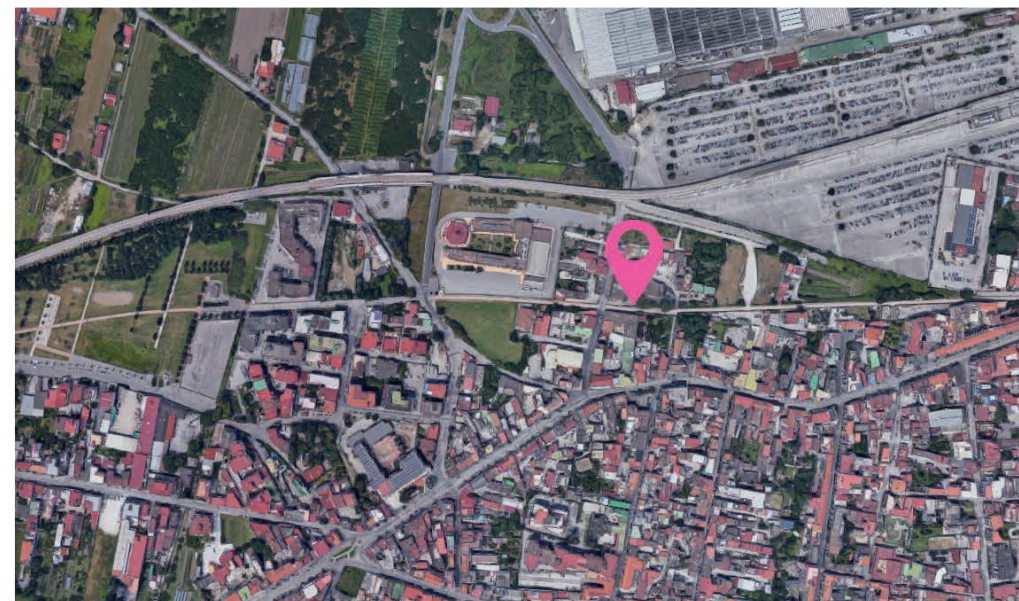
Presidio Via Felice Pirozzi, 20

Da Roma e Caserta - Autostrada A1 Milano-Napoli, svoltare per la SS172 Villa Literno-Pomigliano e uscire a Pomigliano d'Arco.