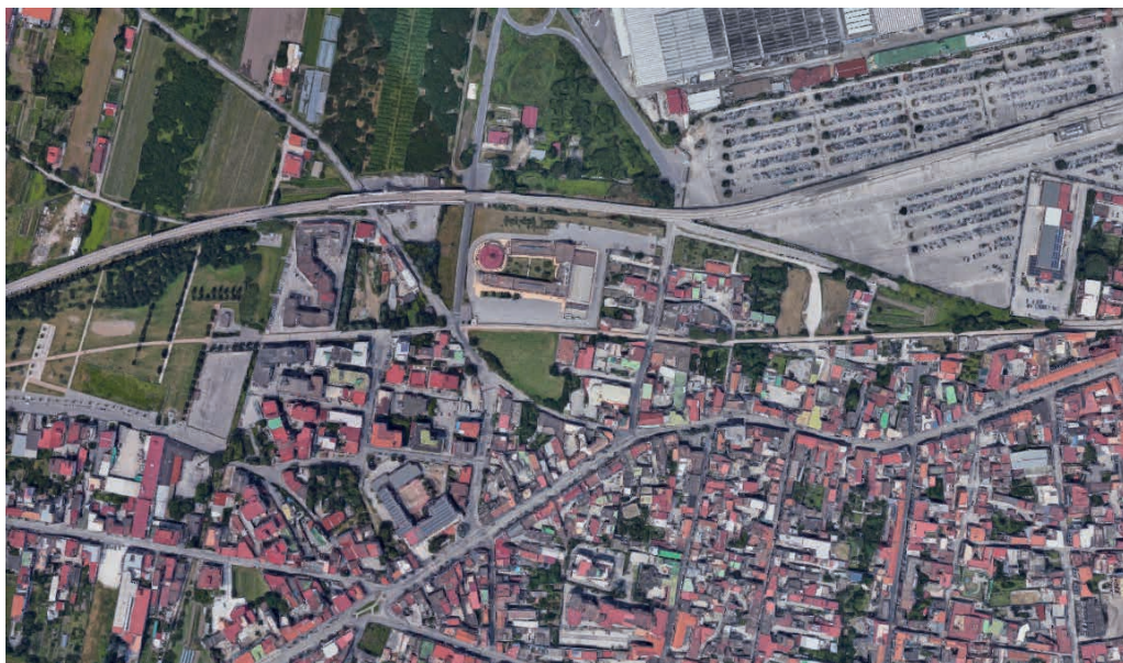
Presidio Via Felice Pirozzi, 20